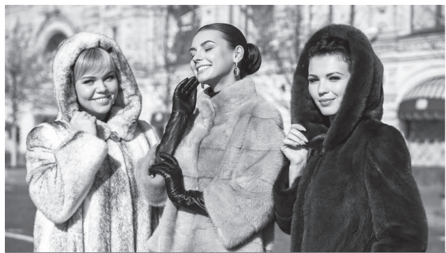
На фото: презентация нашей новой коллекции в Москве

Федеральная сеть «Столица МЕХА» объявляет грандиозную распродажу шуб со складов Кировских и пятигорских фабрик: «БАРС», «Столица МЕХА», «Славяна», «Меховые Мастера» и других! Только одна выставка, где Вы сможете приобрести большинство моделей из наших коллекций 2020 года практически ПО СЕБЕСТОИМОСТИ!