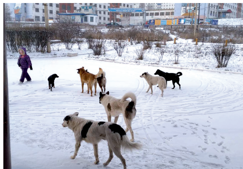
Около районной администрации