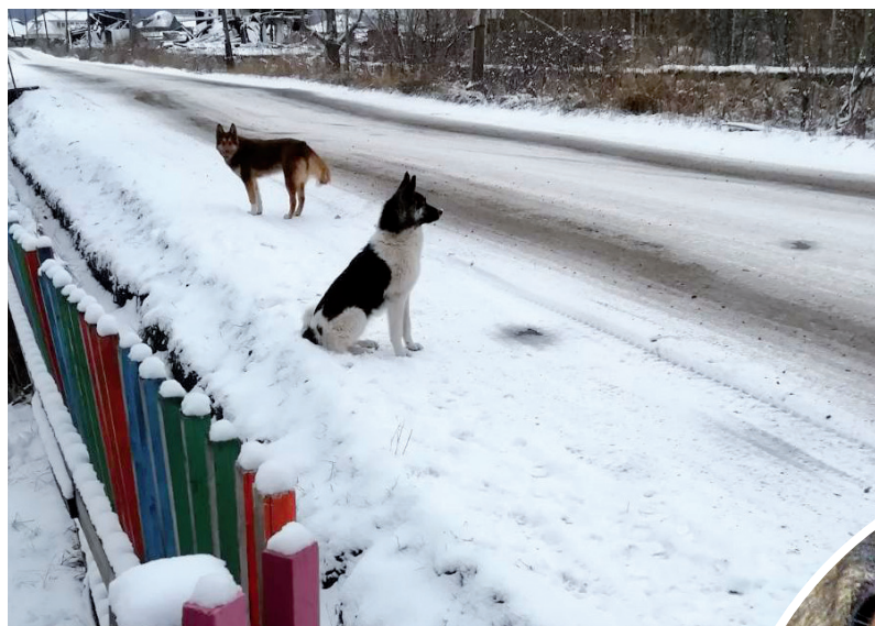
Возле детского сада № 13

Проблема бездомных собак существует в нашем городе уже давно. К нам в редакцию с жалобами на то, что она не решается должным образом, постоянно обращаются читатели.