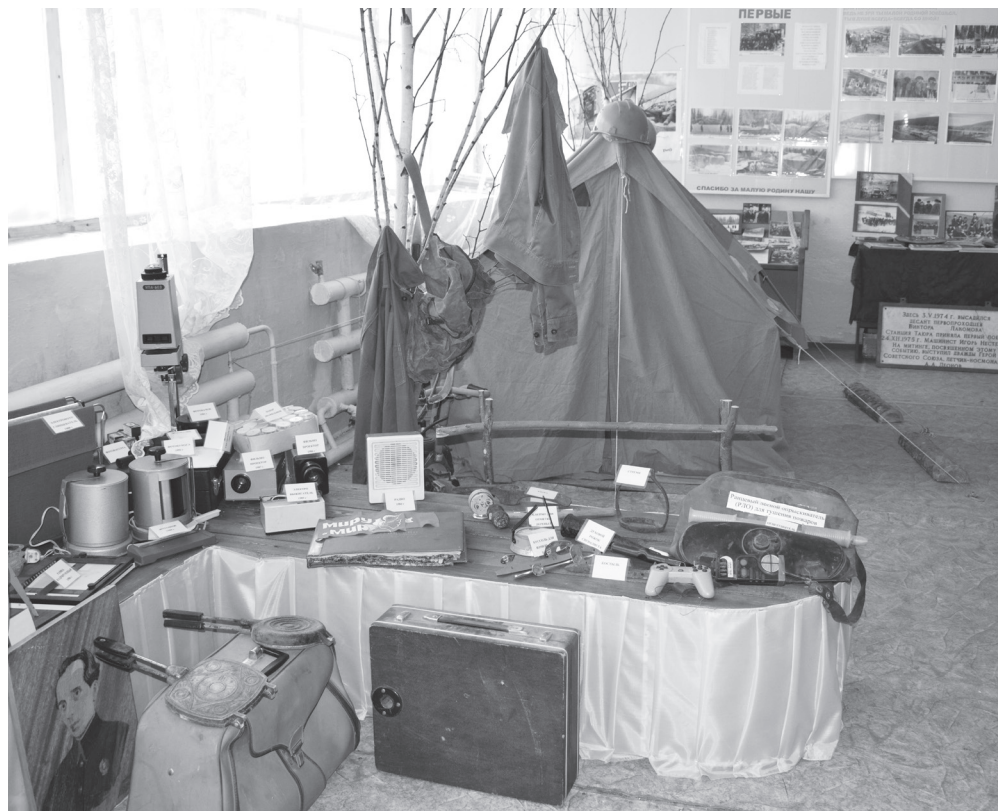
В бамовском зале музея поселка Звездный