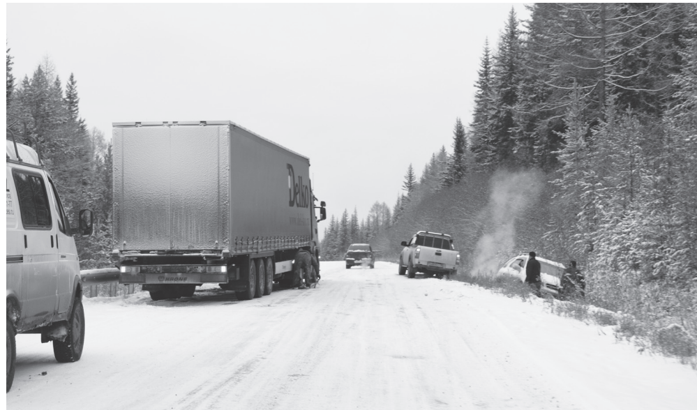
С управлением не могли справиться не только дальнбойщики, но и водители легковых машин

Лес, его деревья, покрытые снежным инеем, выглядели просто сказочно. И было такое ощущение, что мы из глубокой осени попали в снежную зиму.