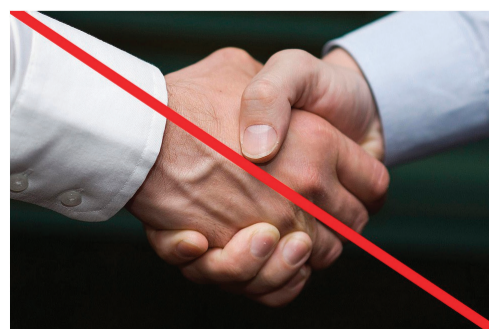
Россиянам на время эпидемии коронавируса следует воздерживаться от рукопожатий

Используйте другие способы для приветствия – кивок или улыбка сжатыми губами.