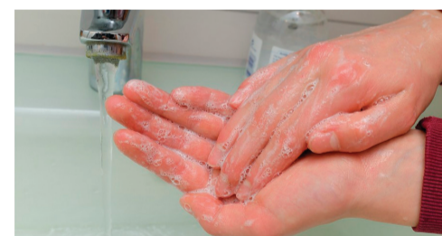
Тщательно мойте руки с мылом, не менее 10 секунд

Делайте это в течение 10 – 20 секунд и/или используйте дезинфицирующее средство для рук на спиртовой основе, содержащее более 60 % спирта всякий раз, когда вы возвращаетесь домой из ЛЮБОГО места, где были другие люди.