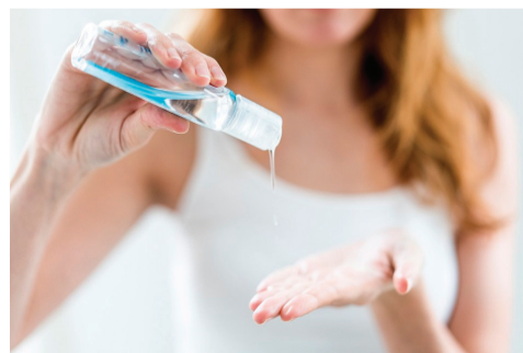
Возьмите в привычку пользование дезинфицирующими салфетками и растворами

В супермаркетах обязательно используйте дезинфицирующие салфетки, чтобы протереть ручки в продуктовых корзинах.