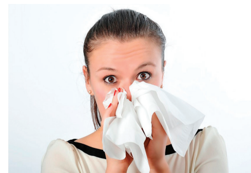
При кашле или чихании используйте одноразовые салфетки

Если возможно, кашляйте или чихайте в одноразовую салфетку и СРАЗУ выбрасывайте ее. Используйте свой локоть, только если нет другой возможности. Одежда на вашем локте будет содержать инфекционный вирус, который может передаваться до недели и более!