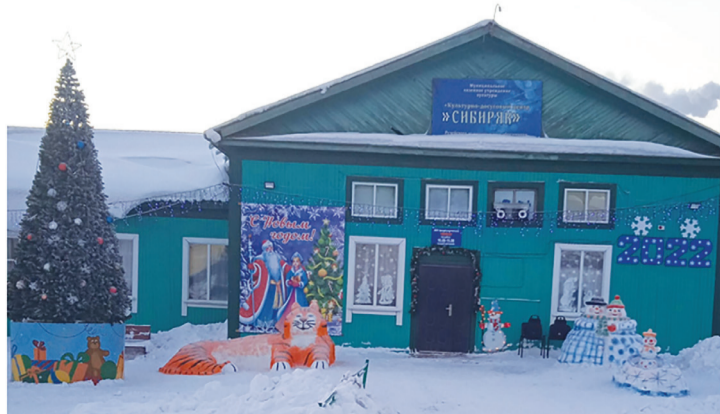
КДЦ «Сибиряк», конкурс снежных фигур