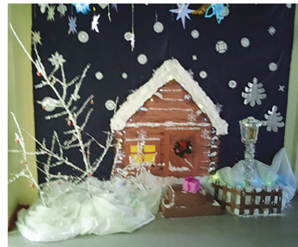
Фотозона, амбулатория п. Ручей