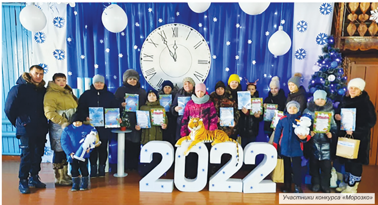
Участники конкурса «Морозко»

Ежегодно проводился конкурс среди организаций, предпринимателей, предприятий торговли на лучшее оформление помещений, фасадов зданий. В этом году решено было изменить формат конкурса и объявить конкурс на лучшую новогоднюю фотозону. Прекрасное и удивительное время года – зима. Она пробуждает фантазию, воображение, желание творить, запечатлеть на память хрупкость зимнего пейзажа, праздничную новогоднюю атмосферу, символы нового года. И участники конкурса очень постарались, представили интересные и замечательные работы. Вот тут уже не было предела фантазии у участников – творческие задумки, креативность. Больше шансов победить в конкурсе было у тех участников, чья фо-