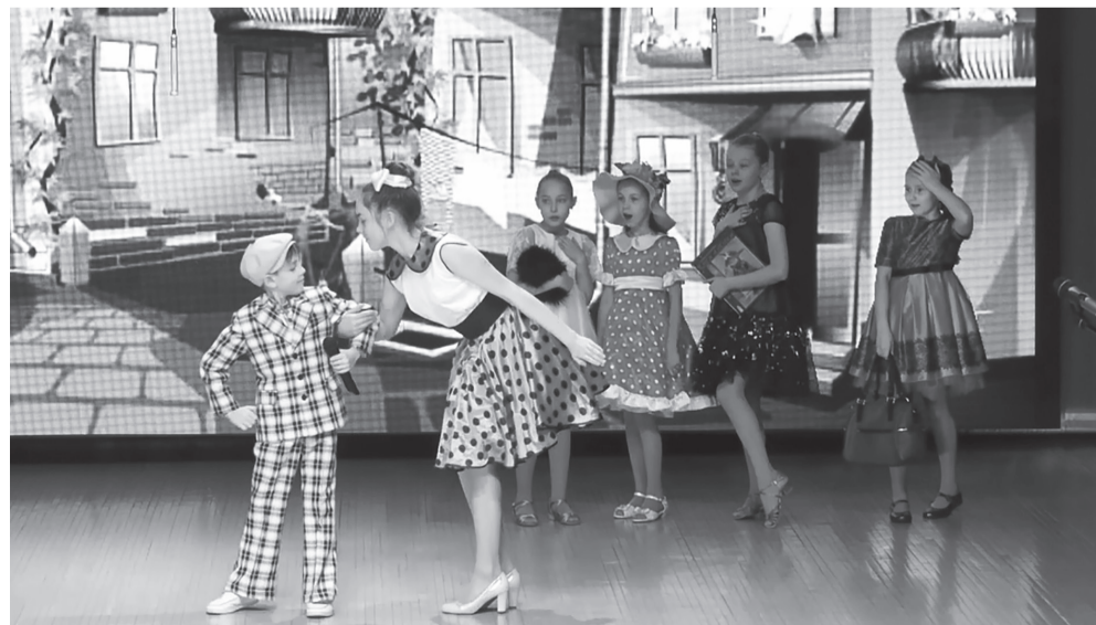
Юниоры: «А у нас во дворе...»