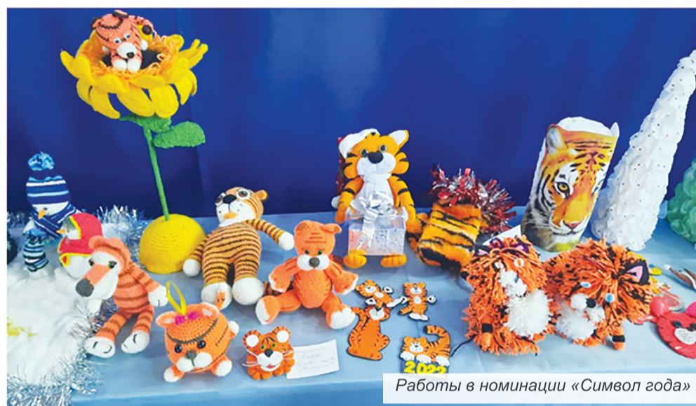
Работы в номинации «Символ года»