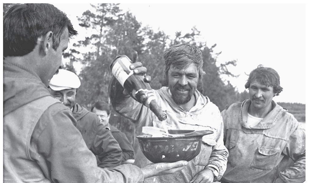
...и его уникальная бригада

Был ещё один повод неустанно следовать журналистам за поездом. Работа путеукладчика – этого сложного механизированного комплекса – явление впечатляющее, завораживающее, невольно притяги-