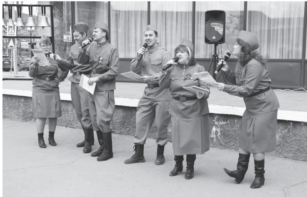
Звон Победы 9 мая 2021 года

Отдельная моя любовь к проекту «О чём поёт колокол», в результате реализации которого была открыта студия по обучению художественному колокольному звону «Гармония». Понимая духовную и патриотическую значимость этого проекта, мы хотели через общение со звонницей, через самостоятельное извлечение колокольных звонов привлечь