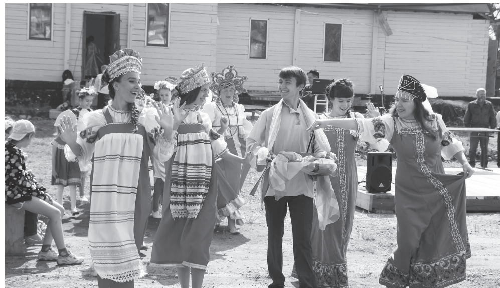
Молодёжь открывает ярмарку «Яблочный Спас»