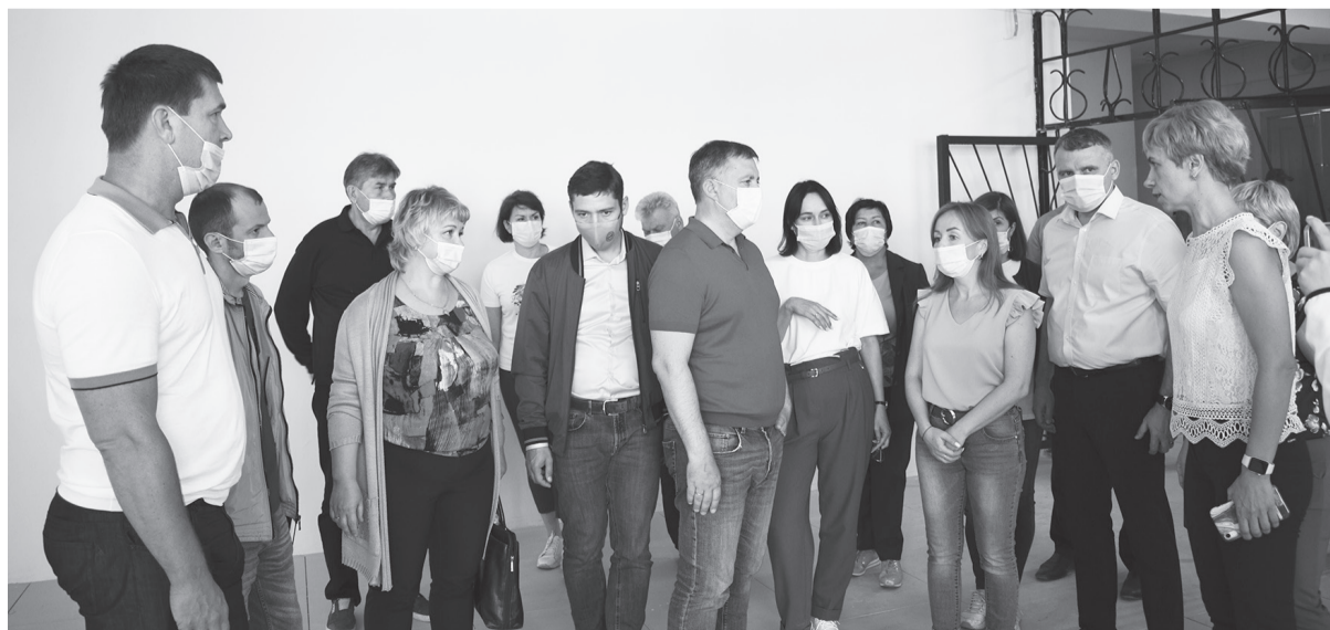
В КДЦ «Украинка» продолжается косметический ремонт помещений. Досуговый центр нуждается в ремонте фасада здания