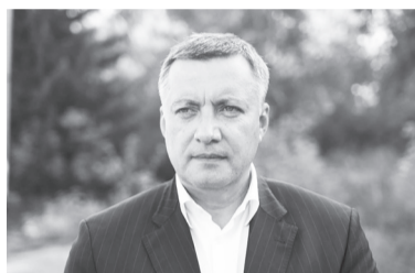
Игорь КОБЗЕВ, Губернатор Иркутской области:

Общая стоимость пяти проектов в Иркутской области оценивается в 530 млн. рублей, из которых 320 млн. — федеральная премия победителям, около 80 млн. рублей — средства областного бюджета. На реализацию проектов также привлекаются средства местных бюджетов и внебюджетные источники.