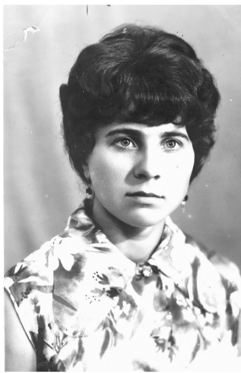
1973 год. Как молоды мы были, как искренне любили, как верили в себя...

У семейной пары двое детей, трое внуков, которые, конечно, споят все вместе: «Бабушка рядышком с дедушкой столько лет, столько лет вместе...» Если учитывать, что до свадьбы они ещё пять лет дружили, то получается полвека.