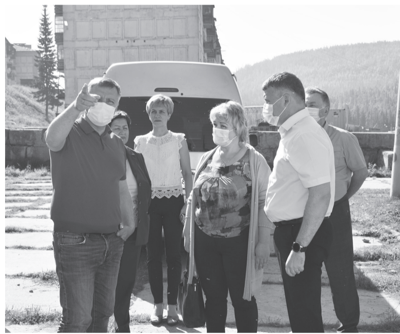
В Янтале Игорь Кобзев поинтересовался исполнением вопросов, озвученных перед ним в прошлый приезд

Подробный репортаж о пребывании Губернатора Игоря Кобзева в Усть-Кутском районе читайте в следующем номере.