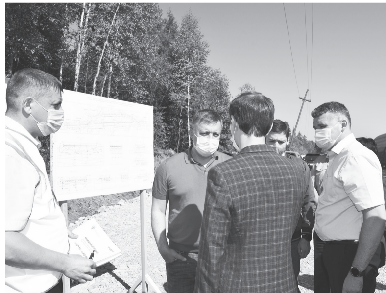
Разговор о ремонте дороги в Мостоотряд перешёл в обсуждение вопросов социально-экономического партнёрства с Росавтодором