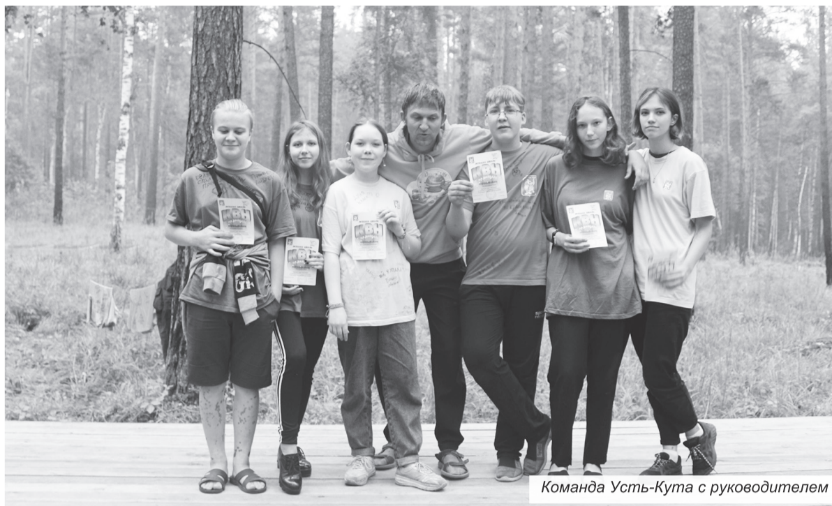
Команда Усть-Кута с руководителем

– В этом году запускается уже шестой сезон районной лиги КВН «Лена БАМ», в которой принимают обычно участие пять-шесть команд. Как прави-