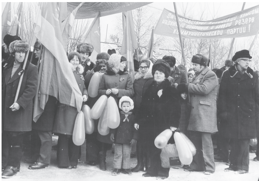
Очень ярко, интересно в то время проходили все демонстрации