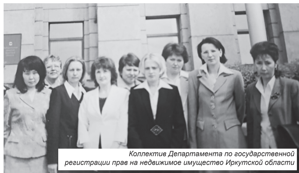
Коллектив Департамента по государственной регистрации прав на недвижимое имущество Иркутской области