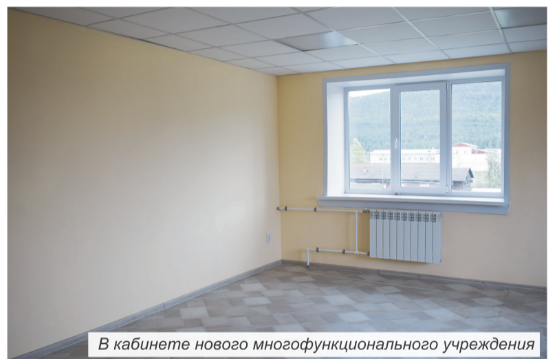
В кабинете нового многофункционального учреждения