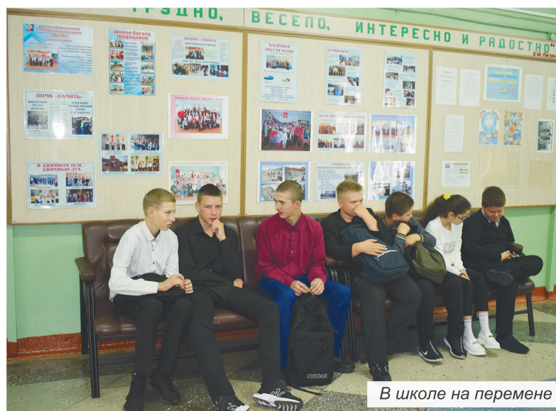
В школе на перемене