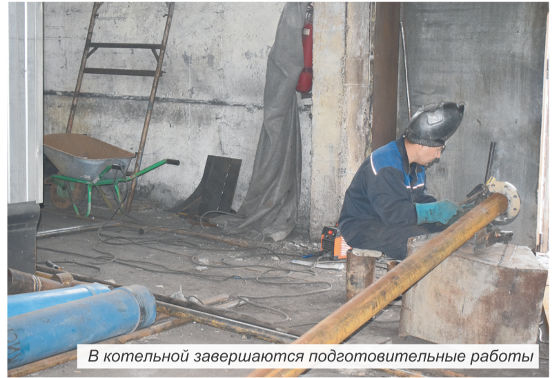
В котельной завершаются подготовительные работы