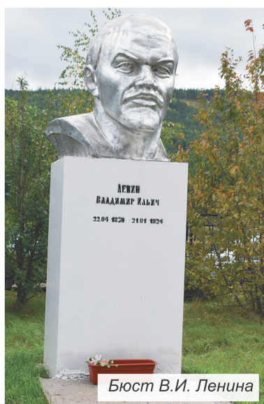
Бюст В.И. Ленина