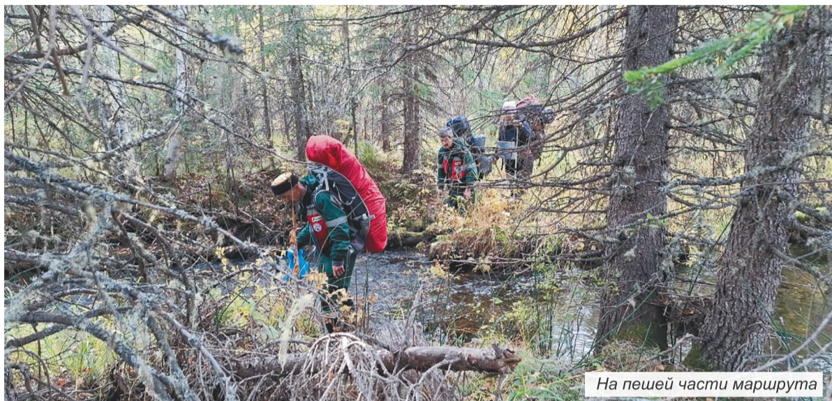
На пешей части маршрута