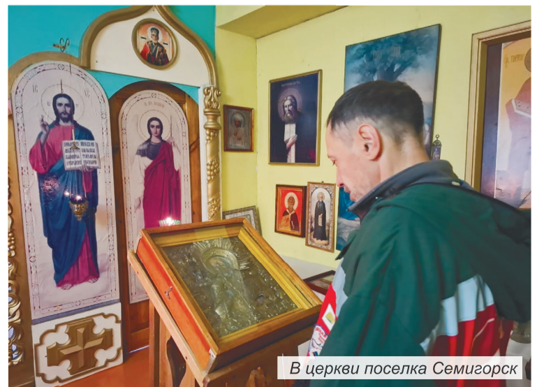
В церкви поселка Семизорск