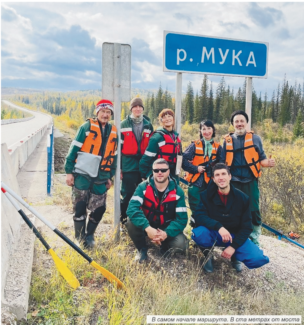
В самом начале маршрута. В ста метрах от моста