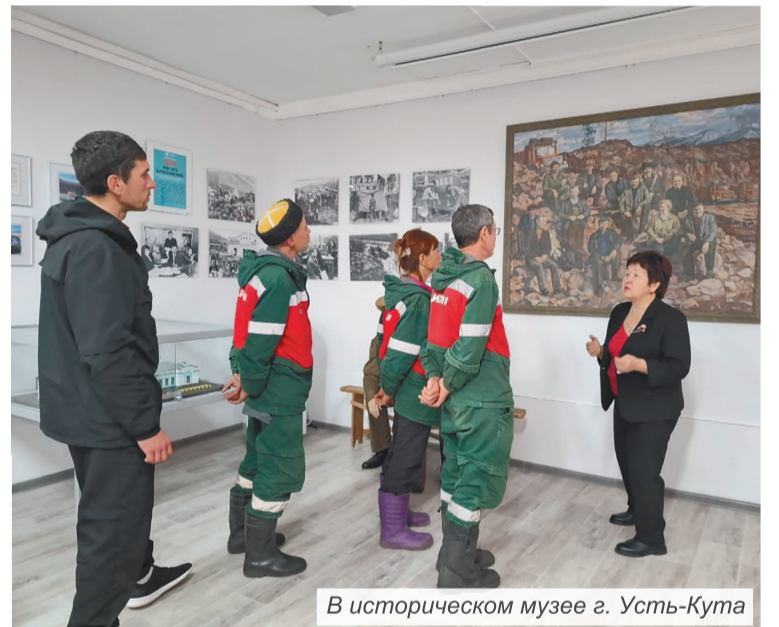
В историческом музее г. Усть-Кута