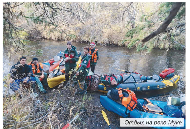
Отдых на реке Муке