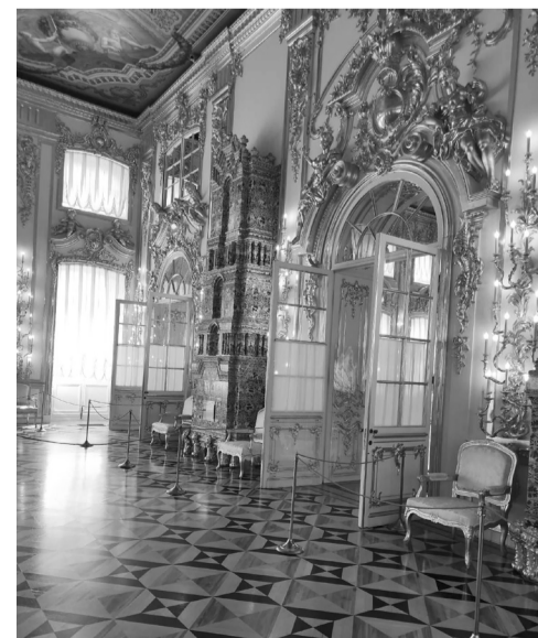
Внутренние залы дворцов богато декорированы позолотой