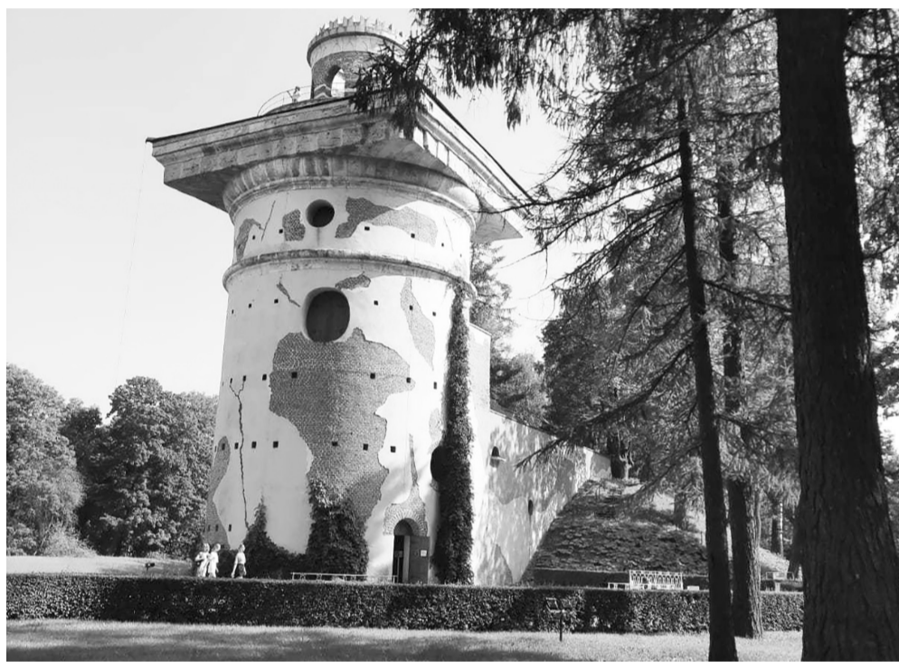
Чесменская башня в Царском Селе