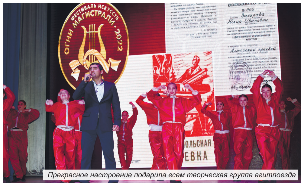
Прекрасное настроение подарила всем творческая группа агитпоезда