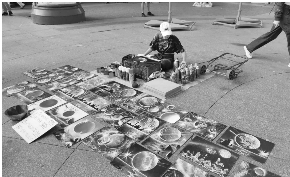
Вместо кисти баллончик с краской – и картины рождаются на глазах публики