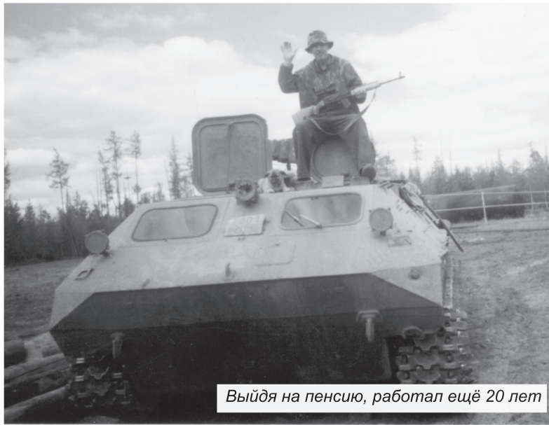
Выйдя на пенсию, работал ещё 20 лет

Татьяна БАРКЛАТЬЕВА.