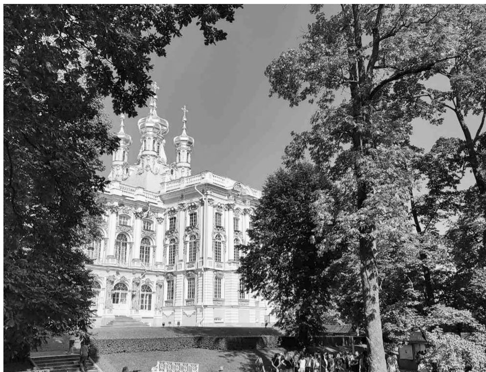
Екатерининский дворец в Царском Селе