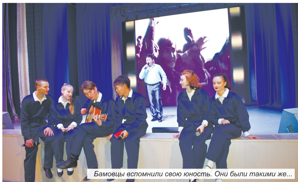
Бамовцы вспомнили свою юность. Они были такими же...