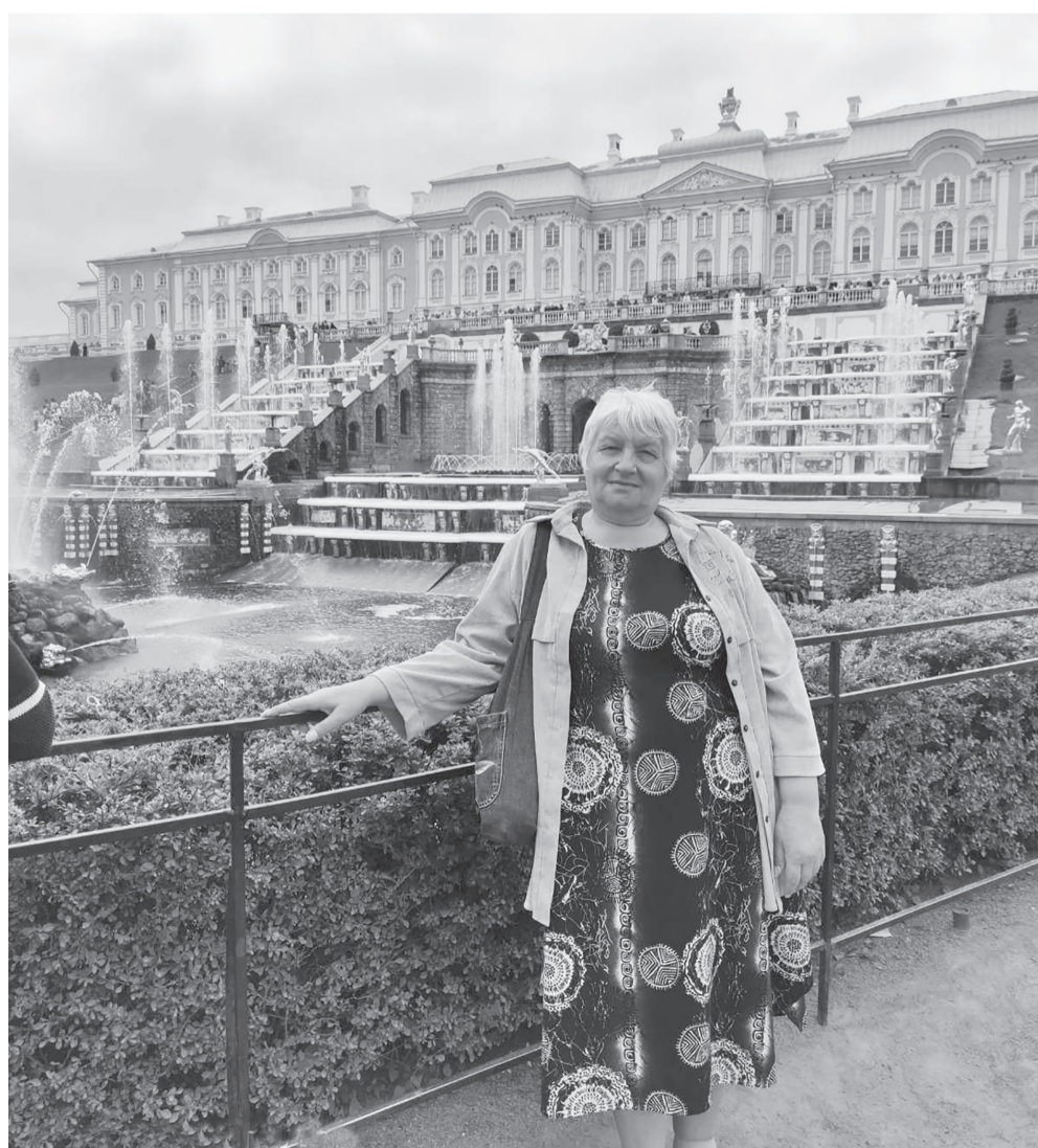
Петергоф славится своими фонтанами

О Петергофе написано и сказано так много, что нет необходимости повторяться. Интерес к нему не ослабевает с го-