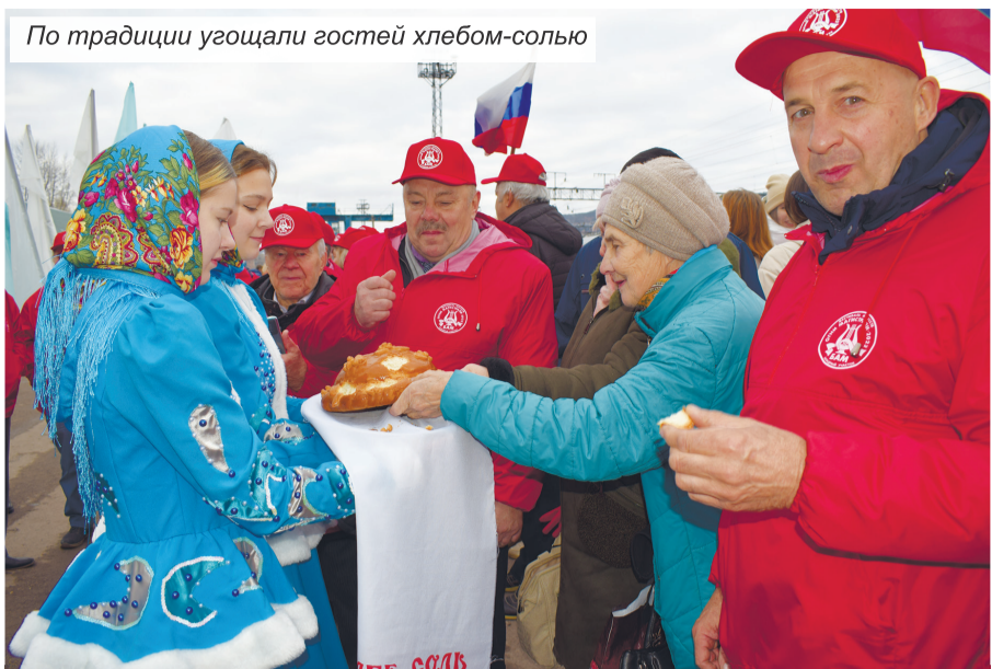
По традиции угощали гостей хлебом-солью