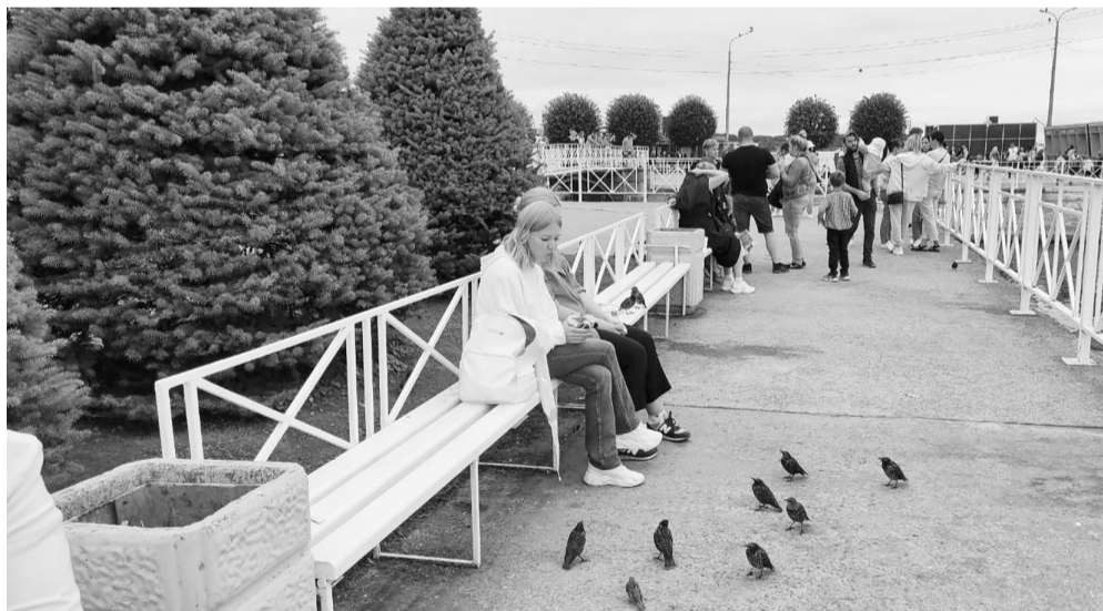
Скворцы в Петергофе буквально выпрашивают угощение