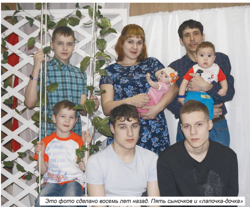
Это фото сделано восемь лет назад. Пять сыночков и «лапочка-дочка»