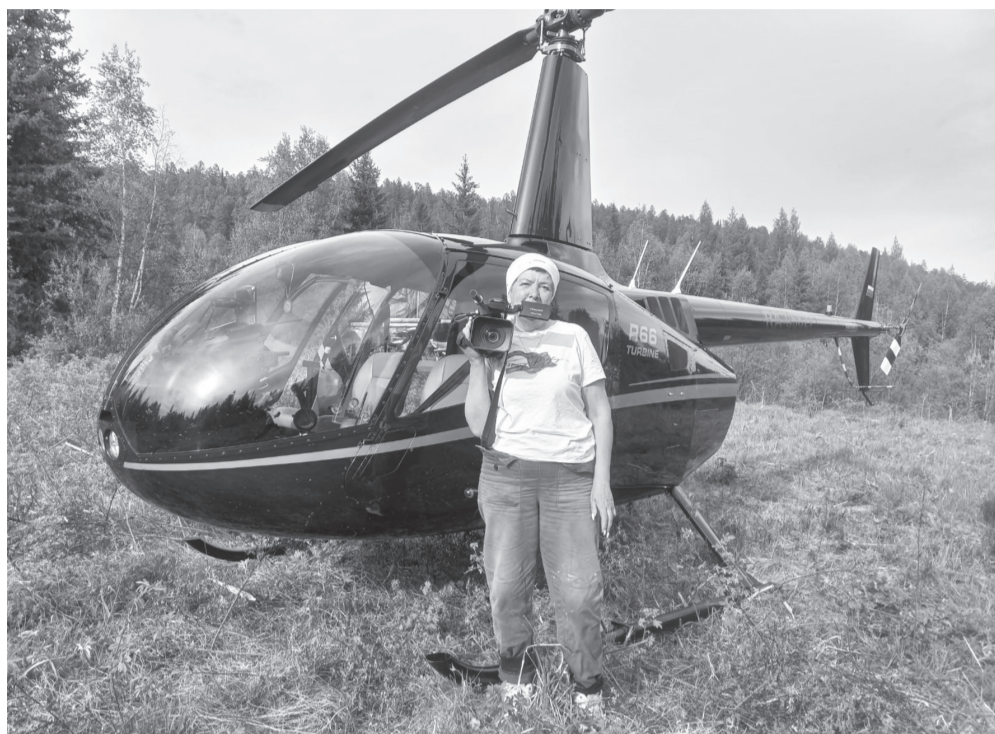
Экспедиция в устье реки Бильба (Усть-Кутский район)