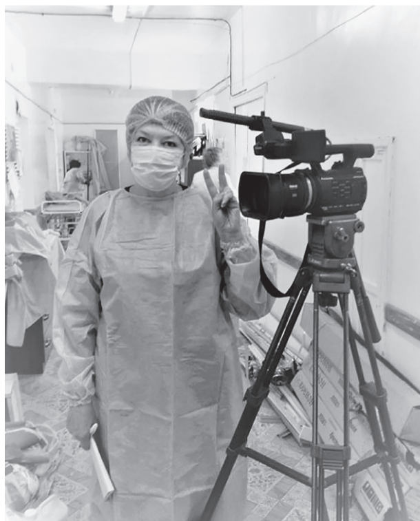
Съемки мероприятия по повышению квалификации усть-кутских хирургов-эндоскопистов