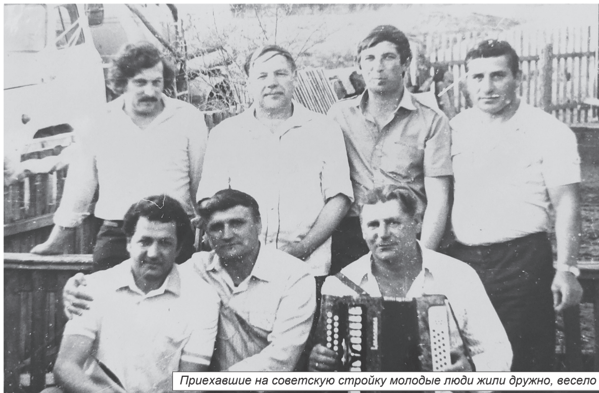
Приехавшие на советскую стройку молодые люди жили дружно, весело