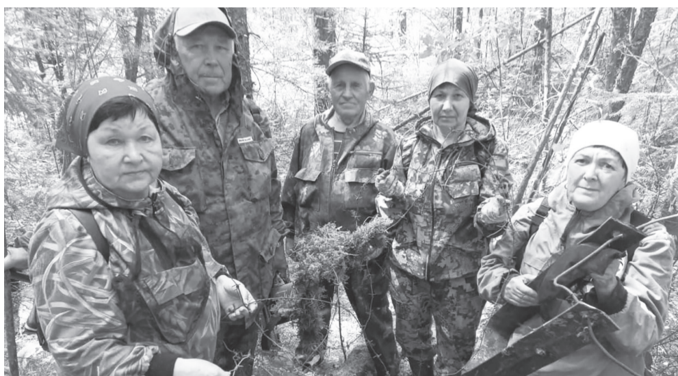
Экспедиция по установлению месторасположения женского лагеря

Мы не смотрели телевидение – мы его делали!