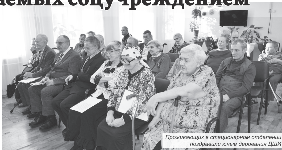
Проживающих в стационарном отделении поздравили юные дарования ДШИ

На первом этаже проживают маломобильные граждане (лежачие, колясочники), которым необходима круглосуточная помощь. На втором – живут те, кто может передвигаться само-