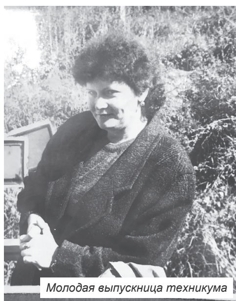
Молодая выпускница техникума

Работа на железной дороге во все годы была нелёгкой, напряжённой, ответ-