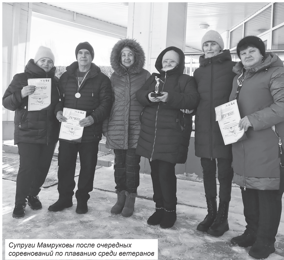
Супруги Мамруковы после очередных соревнований по плаванию среди ветеранов