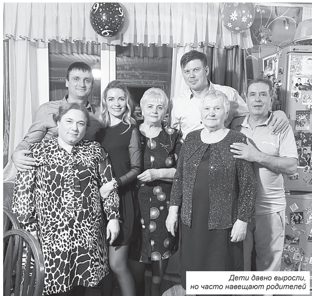
Дети давно выросли, но часто навещают родителей

Они, конечно, знали, где трудятся родители, часто и на работу к ним забегали. Не удивительно, что все выбрали