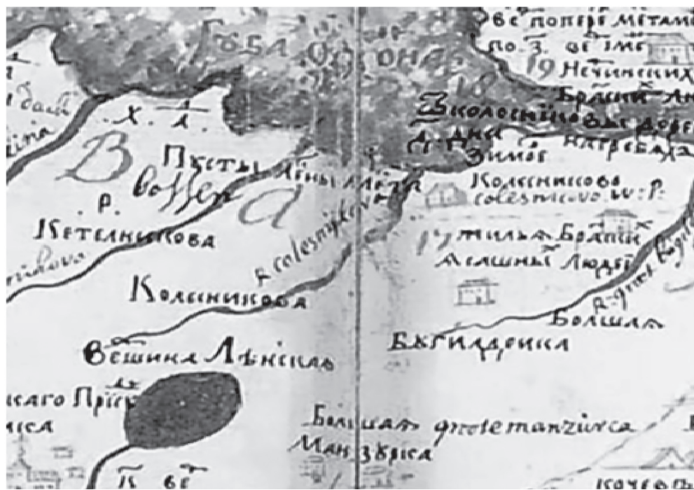
Фрагмент карты С. У. Ремезова «Чертеж земли Иркутского города»

✓ Думается, что выход Колесникова на Байкал в 1635 г. маловероятен, а время совместной службы Колесникова и Пятка Федорова возможно отнести к 1636 г., при этом поход к озеру, если он состоялся, мог быть и без участия последнего.