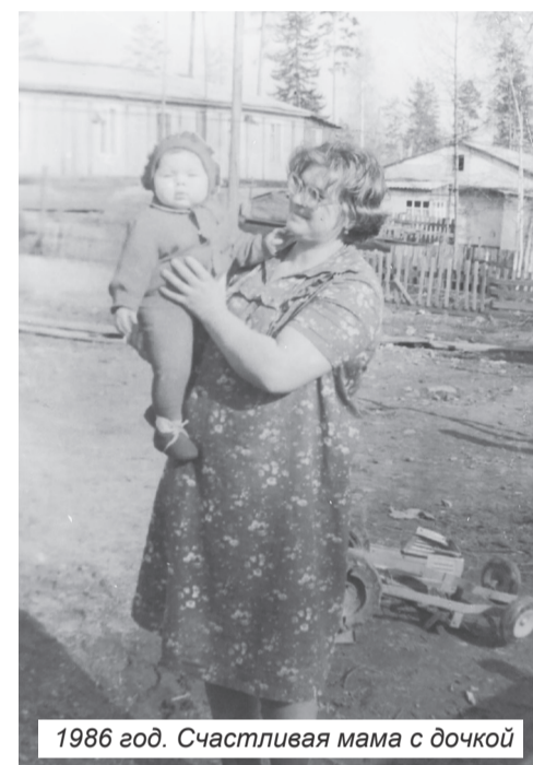
1986 год. Счастливая мама с дочкой