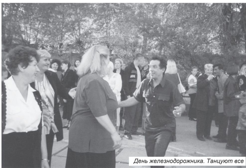
День железнодорожника. Танцуют все

– Принимала поступающие грузы, занималась оформлением документов, организовывала выдачу. Работа серьёзная, ответственная. Потом на станцию Якурим перевели. В 1993 году перешла на ПКО приёмщиком поездов, где работала до 2014 года. Часто бывала в командировках, на семинарах, на повышении квалификации.