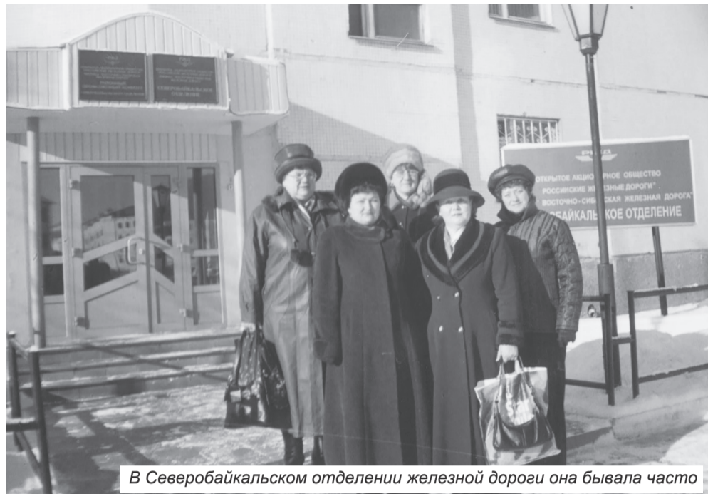
В Северобайкальском отделении железной дороги она бывала часто