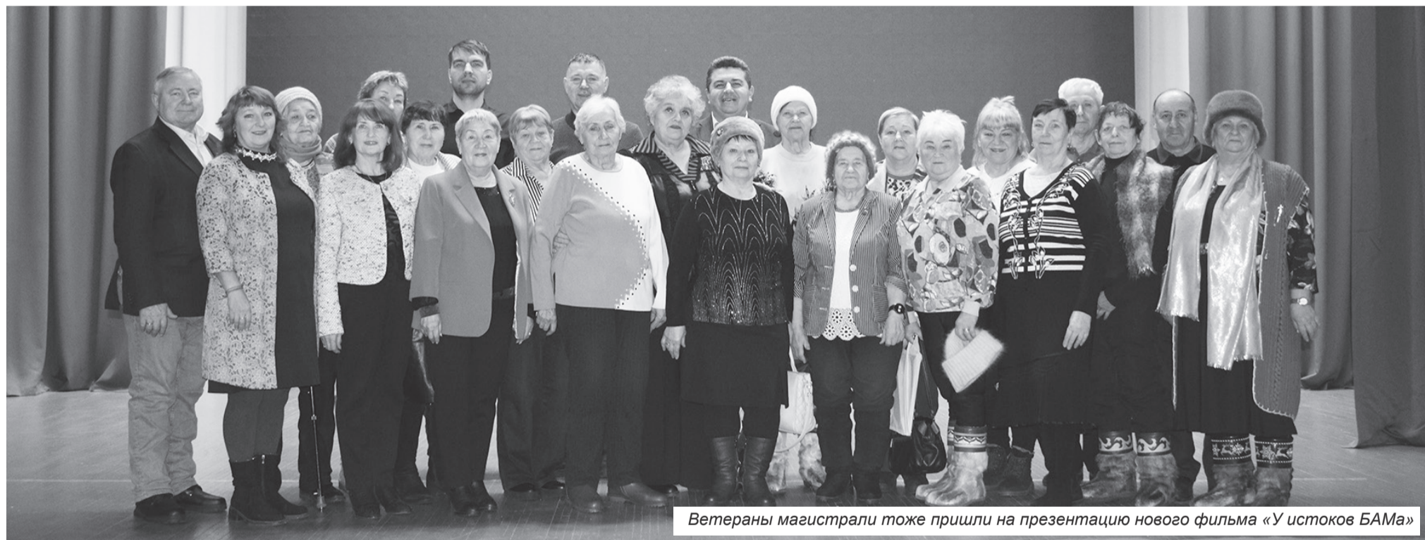
Ветераны магистрали тоже пришли на презентацию нового фильма «У истоков БАМа»