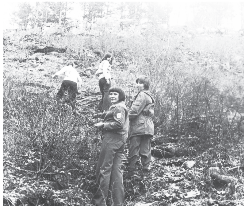
Дружно карабкаются на сопку Любви