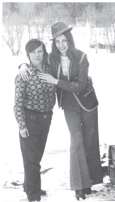
Проводы зимы в зимовье