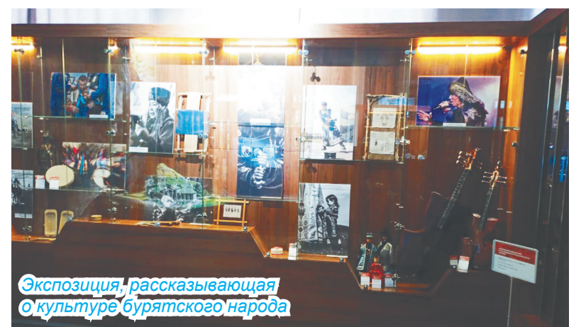
Экспозиция, рассказывающая о культуре бурятского народа