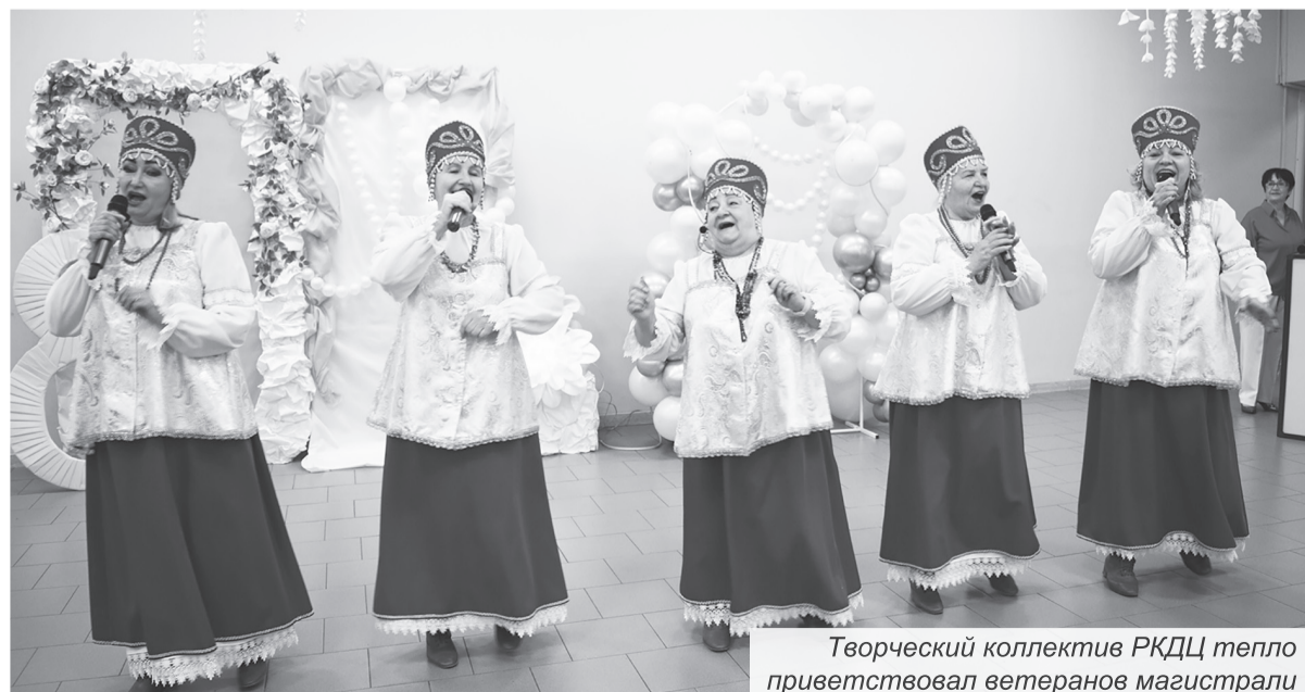
Творческий коллектив РКДЦ тепло приветствовал ветеранов магистрали