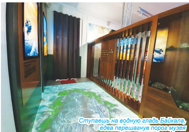
Ступаешь на водную гладь Байкала, едва перешагнув порог музея